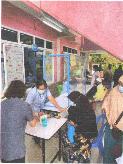
ภาพประกอบกิจกรรมโครงการหมรรถรมคัดกรองภาวะแทรกซ้อนผู้ป่วยเบาหวานและความดันโลหิตสูง คปสอ. ยี่งอ ปี 2564